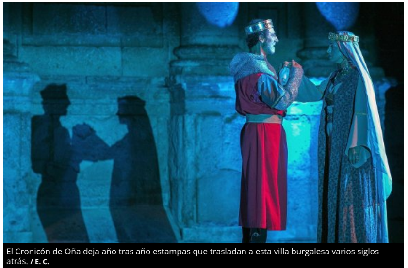
El Cronicón de Oña deja año tras año estampas que trasladan a esta villa burgalesa varios siglos atrás.

Prometen desde la asociación que el espectáculo consigue deslumbrar al visitante y, lo más importante, que se trata de un proyecto colectivo en el que se vuelca gran parte de la pequeña población de Oña (con poco más de 850 habitantes), «que cumplen con seriedad su compromiso de ensayar, de trabajar preparando el vestuario y los escenarios» y que, en esencia, «sienten la necesidad de conocer y explicar su propia historia». Y todavía más: «Después de ver El Cronicón, el profano consigue entender por fin las difíciles relaciones que afrontaron el reino de León y el condado de Castilla entre los siglos X y XI, y qué papel desempeñó cada uno de sus protagonistas».